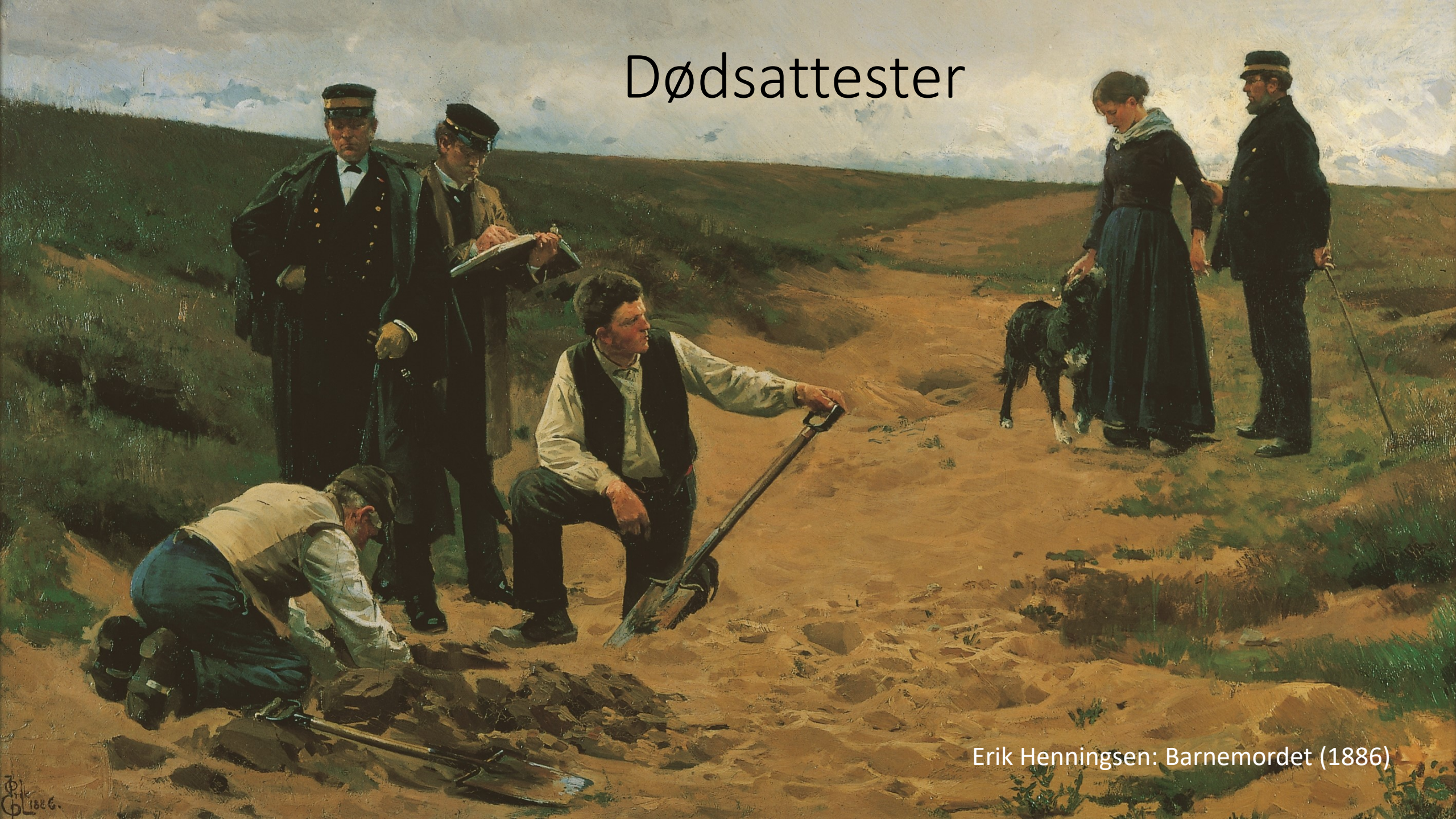
Erik Henningsen: Barnemordet (1886)