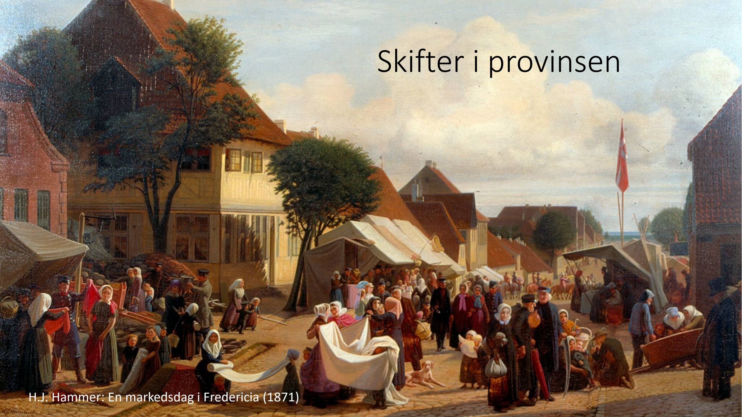
H.J. Hammer: En markedsdag i Fredericia (1871)