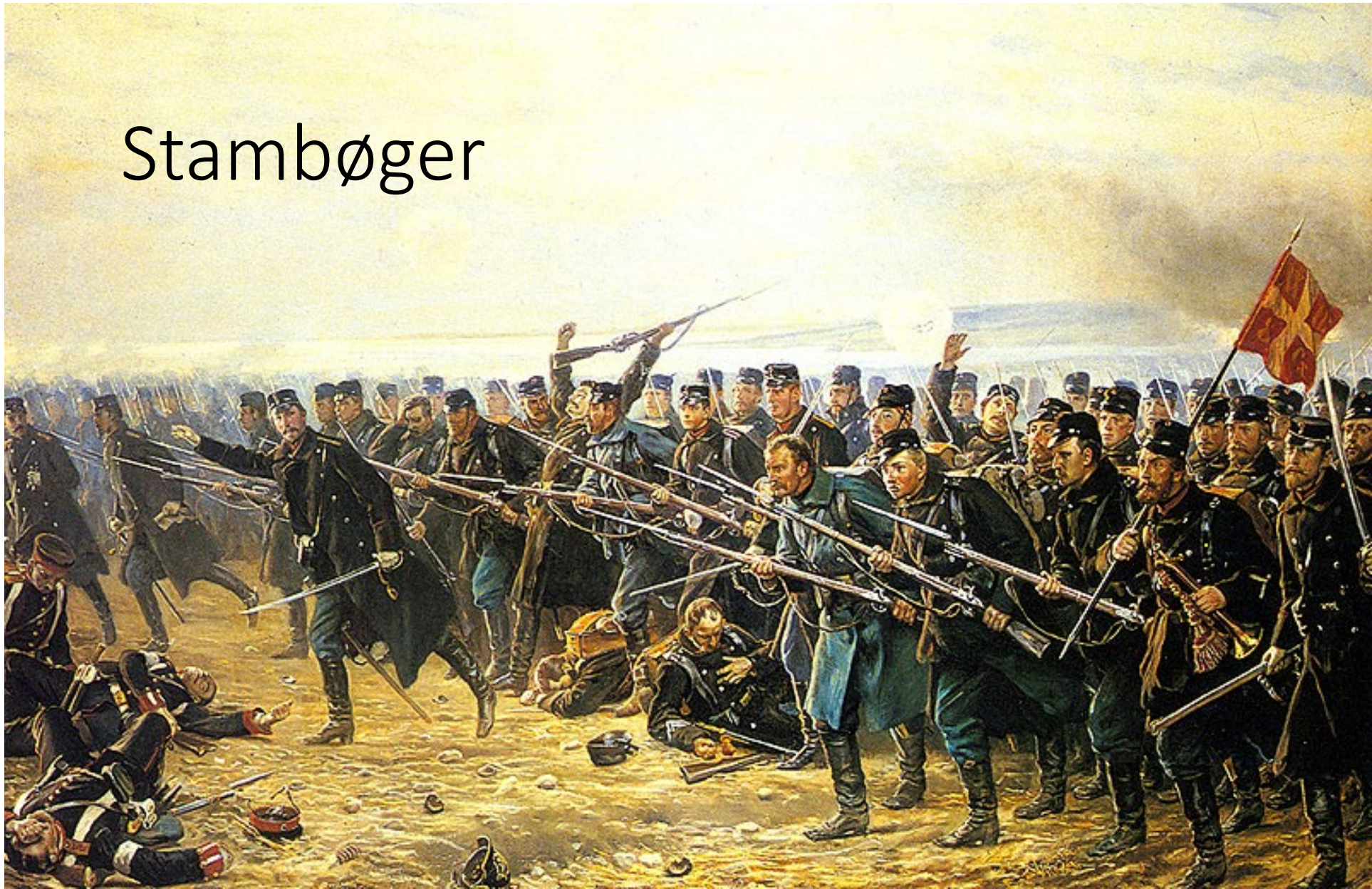
Slaget ved Dybbøl 18. april 1864