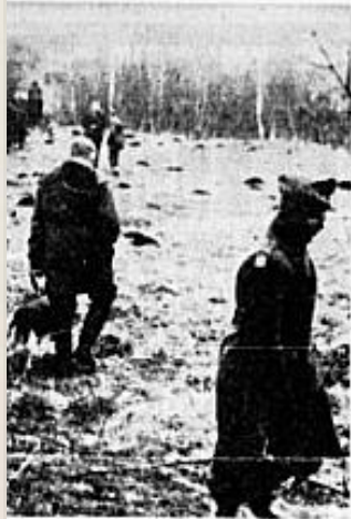
Kammeret oprundet, hvor man senere opdagede...

En avisartikel fra 1964 kunne fortælle om den sidste hændelse og hans efterfølgende død.