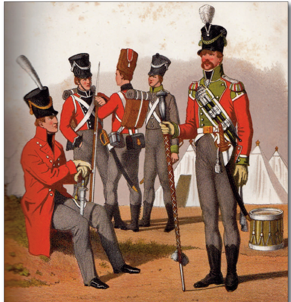
Fodfolkssoldater 1813. Tegning af F.C. Lund