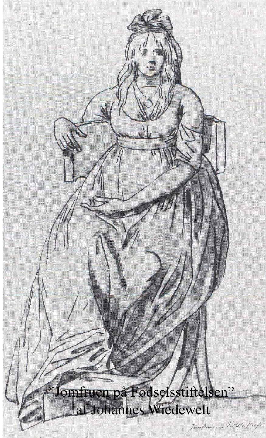
”Jomfruen på Fødselsstiftelsen” af Johannes Wiedewelt