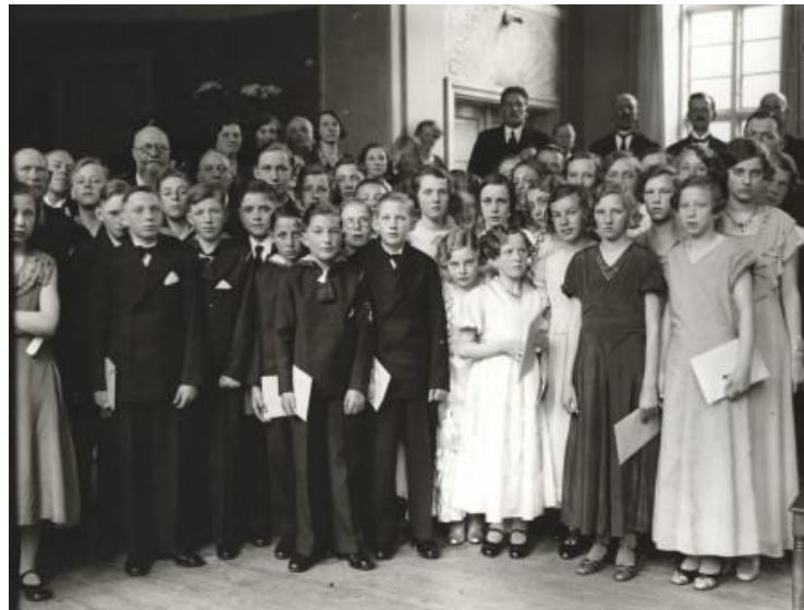
Borgerlig konfirmation 1934

Tidsperiode: Fra 1915 til 1976 (50 års tilgængelighed)