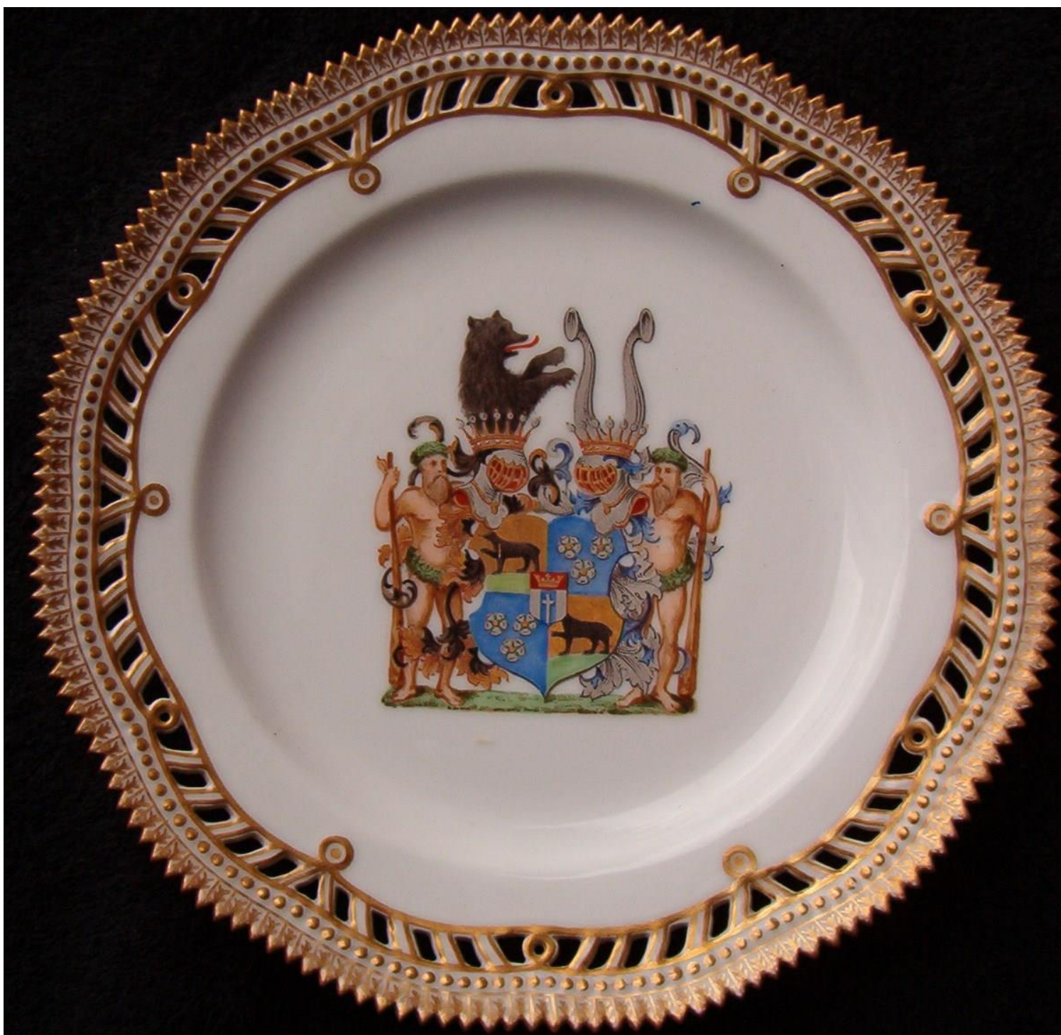
Et friherreligt våben malet på porcelæn fra Den Kongelige Porcelænsfabrik – typisk med skjoldholdere og to hjelme (Baronerne Bertouch-Lehn af baroniet Sønderkarle)