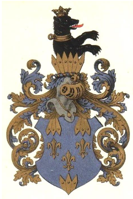
Ubetitlet adels våben ca. 1700 – typisk ingen skjoldholder, en hjelm (von Arensdorff, uradel)