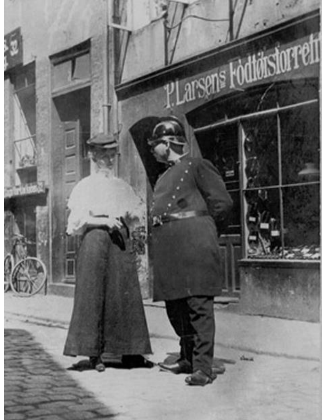
Foto fra København, beg. 1900-tallet